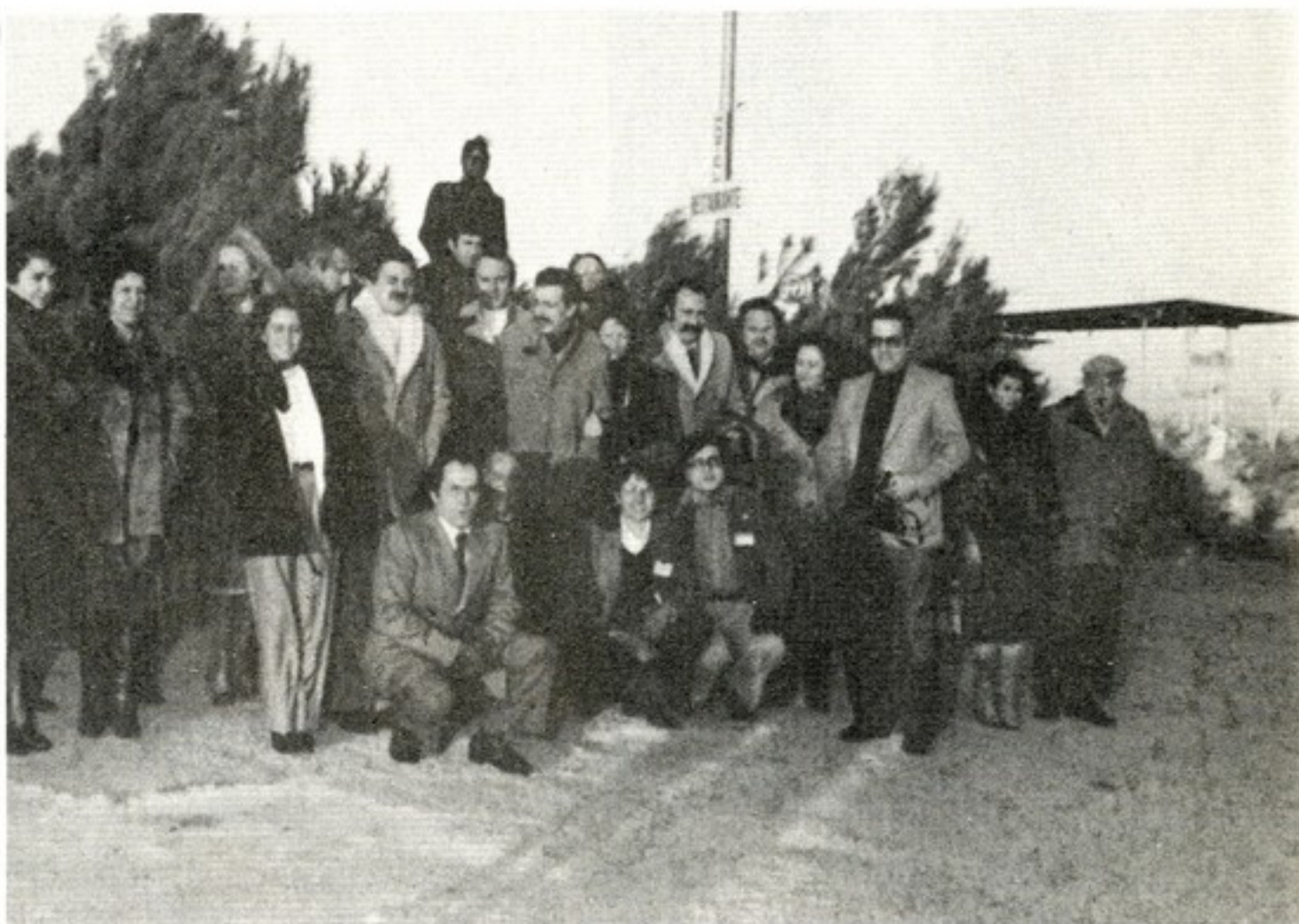
Entre los que desafiaron al frío para tomar la foto, y otros que no se decidieron, nos reunimos cerca de cincuenta, procedentes de todos los distritos (excepto los insulares).

También asistieron amigos con más de trescientos países en el bolsillo, y así pudi-