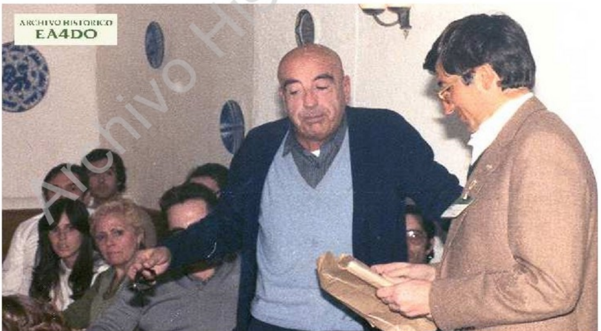
"Juanito", EA2CA, comentando a Isi, EA4DO (2º op) y al resto de los asistentes, lo que fue el DX en los años cincuenta cuando realizó una expedición al entonces país español del mundo del DX. Ifni.