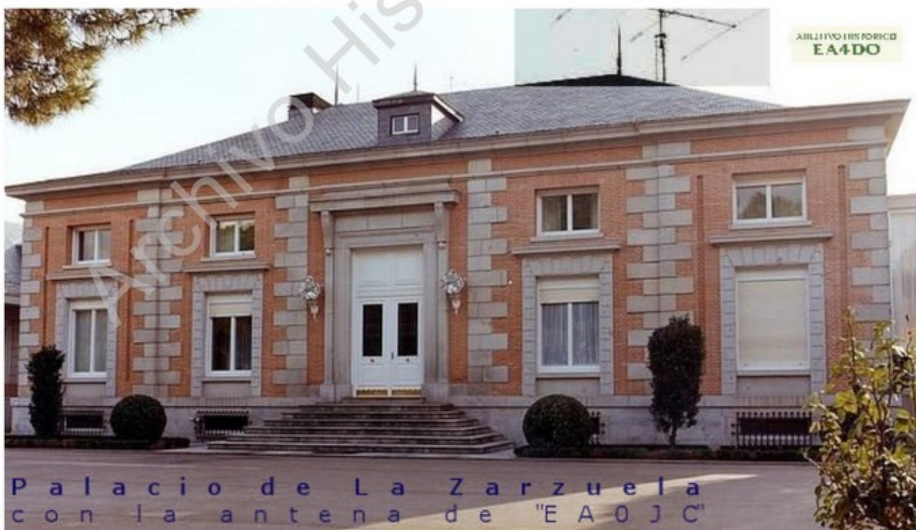
Palacio de La Zarzuela con la antena de "EA0JC"

Procuraremos salvaros las dificultades a todos los que queráis obtenerle, los lunes y jueves, entre 07.00 y 08.00, locales en 14.190, donde nos encontraremos las estaciones de los dos clubs.