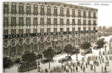
El Hotel Oriente, de Barcelona, no lo solo fue la nueva sede de la Agrupació Catalana de Radioemisors, sino también donde se organizó un festival para la entrega de premios de su último concurso

Mientras que todo lo anterior dio comienzo en Córdoba el Día de la Raza, con la llegada de los amigos de Madrid,