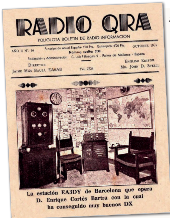
Estación del "operador fotográfico" del grupo EA3 en la portada de Radio QRA de octubre de 1935