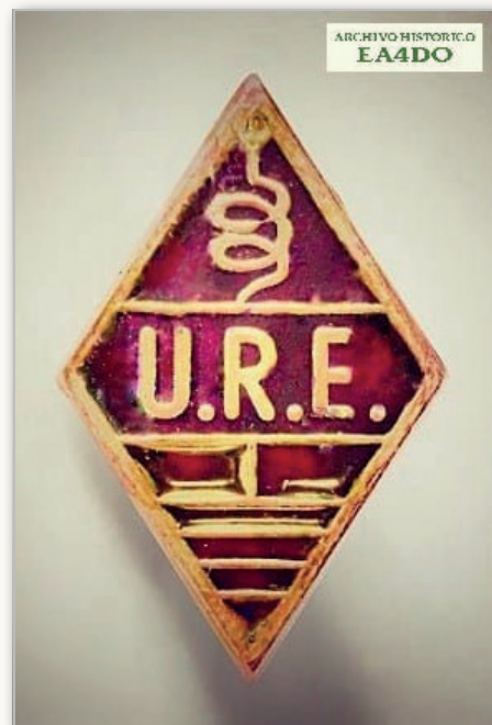
“Insignia de mérito” de U.R.E. en oro y esmalte

Llega a ser tan incorrecta y censurable la actitud adoptada por algunos