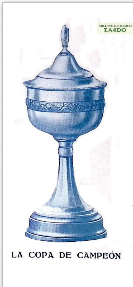
LA COPA DE CAMPEÓN