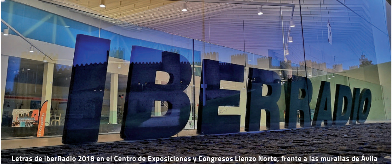
Letras de iberRadio 2018 en el Centro de Exposiciones y Congresos Lienzo Norte, frente a las murallas de Ávila