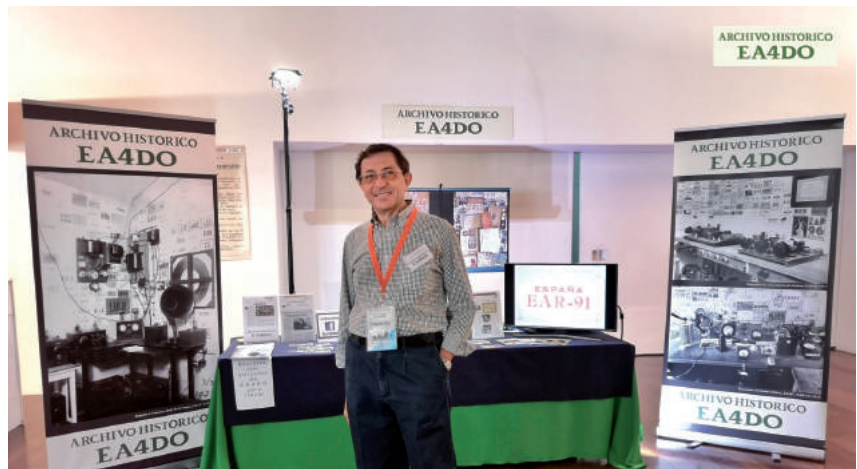
Stand del Archivo Histórico EA4DO en iberRadio 2018