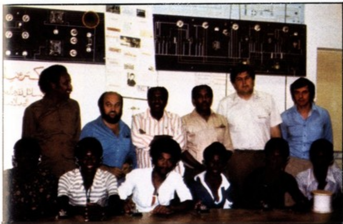
«Nuestro papel no era solamente operar en las bandas, sino también dar clases en el radioclub del Palacio de la Juventud de Khartoum.»

Por Isidoro RUIZ-RAMOS Y GARCIA TENORIO (2.º op. de EA4DO)