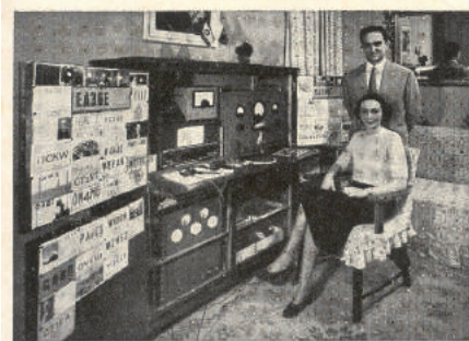
QTH: Avda. República Argentina, 45 - Barcelona (España)