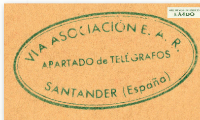
Sello de tinta que se incluyó en el reverso de las QSL's llegadas a "E.A.R. Santander".

Estando formada la Comisión de E.A.R. que intervino en las gestiones del pasado mes de julio por señores alguno hoy son bajan en