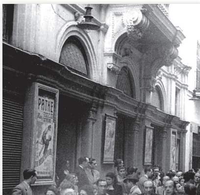
Edificio sevillano del Pathé Cinema en cuyos altos quedó formada la «Asociación de Radioaficionados» el 2 de octubre de 1932. (Foto: sevillaperdida.blogspot.com ).

El magnífico servicio que prestó entonces el Cuerpo de Correos en toda España permitió enviar las referidas líneas el viernes en Santander y llegar el día siguiente al apartado postal de Red Española en Madrid. Tras su estudio, el lunes 10 de octubre fue remitida una extensa respuesta a los directivos interinos de E.A.R.