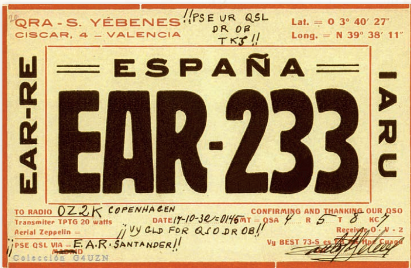
Tarjeta fechada el 17 de octubre de 1932 en la que Santos Yébenes pide le envíen la QSL al nuevo buró de la Asociación, "E.A.R. Santander" (Col. Anthony Quest. G4UZN)

QSL's vía "E.A.R. Santander". Allí, con la finalidad de controlar el tráfico en el buró de la capital cántabra se dispuso de un sello de tinta que fue estampado en color verde sobre el reverso de las tarjetas.