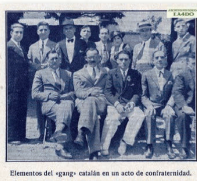
Elementos del «gang» catalán en un acto de confraternidad.

Nadie podrá encontrar en estas páginas la más leve censura para nadie; sólo hay en ellas elogios, y muy merecidos por