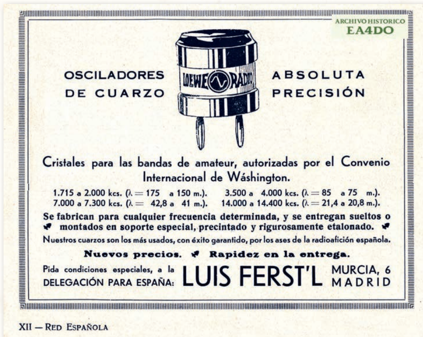
Anuncio de cristales "Loewe Radio" en el boletín Red Española .