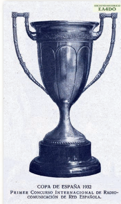
COPA DE ESPAÑA 1932 PRIMER CONCURSO INTERNACIONAL DE RADIO- COMUNICACIÓN DE RED ESPAÑOLA.

En octubre de 1931, “Córdoba” estuvo pasando una corta temporada en Valencia para colaborar en la preparación de la estación de Unión Radio, “Radio Valencia”, que pronto comenzaría a prestar el servicio de radiodifusión. Entonces el operador de la EAR-96 quiso aprovechar su estancia en la capital del Turia para [...] inyectar a nuestros camaradas de aquél gang el microbio del QRO (mayor potencia) + CC (“Crystal Control”). Del cultivo de este, pronto se aperibirán el resto de los camaradas de la Península. Levante se pre-