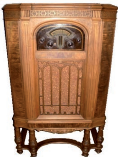
Atwater Kent 480 fabricado en 1932 dotado con dos bandas de onda media y tres de onda corta. Fue el primer modelo de Atwater Kent que tuvo cobertura total de la banda de onda corta. Contaba con 10 válvulas y se conectaba a la red de corriente alterna

Radio Sport de 1932 apareció la clasificación del Concurso nacional de fonistas que organizó la asociación Red Española en el que EAR-VL quedó en 7º lugar. El diario El Pueblo Gallego , el 1 de septiembre de 1932 publicó un artículo en el que dejaba constancia de ello, dedicándole grandes elogios al radioaficionado pontevedrés.