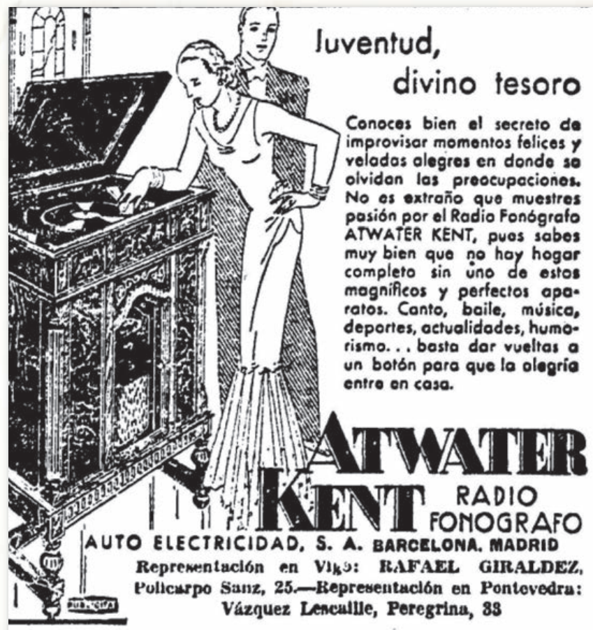
Anuncio del radio fonógrafo Atwater Kent, publicado en un periódico de 1932